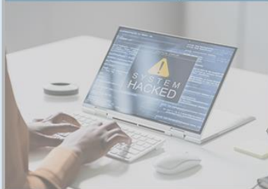
Praxisausfall und Betriebs- unterbrechungen