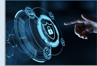
Datenschutz und Cybersicherheit