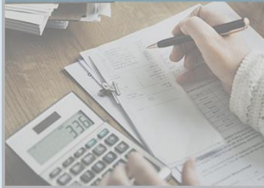
Finanzielle Stabilität und Liquiditätsrisiko