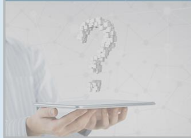
Rechtliche Risiken und Haftungsfragen