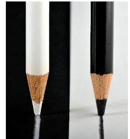
Summen- und Konditionen- Differenz